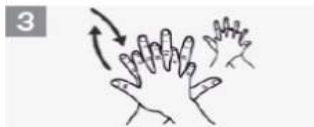
3 Palma da mão direita no dorso da esquerda, com os dedos entrelaçados e vice-versa