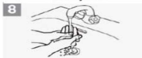
8 Enxagüe as mãos com água