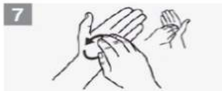
7 Esfregue rotativamente para trás e para a frente os dedos da mão direita na palma da mão esquerda e vice-versa