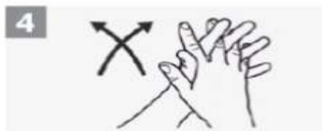
4 Palma com palma com os dedos entrelaçados