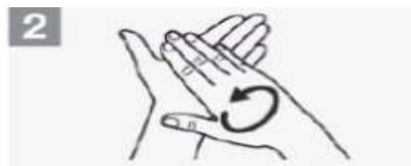
2 Esfregue as palmas das mãos, uma na outra