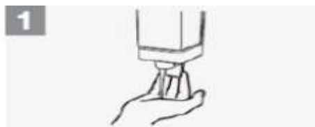
1 Aplique sabão para cobrir todas as superfícies das mãos