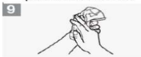
9 Seque as mãos com toalhete descartável