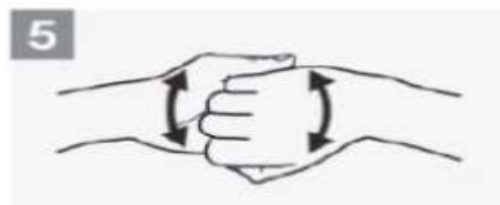
5 Parte de trás dos dedos nas palmas opostas com os dedos entrelaçados